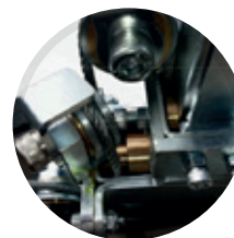
Argano a distanza dal corpo macchina