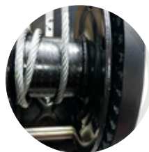
Argano con carter di protezione ingranaggi